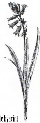
Wilde hyacint Kleur van de bloemen: blauw, wit of rozerood