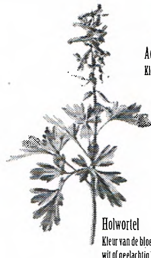
Holwortel Kleur van de bloemen: purperkleurig, wit of geelachtig