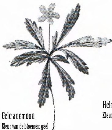
Gele anemoon Kleur van de bloemen: geel