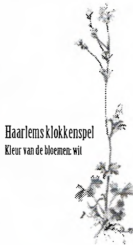
Haarlems klokkenspel Kleur van de bloemen: wit