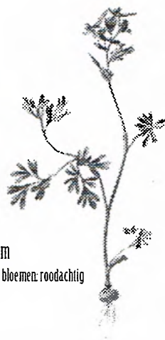
Helmbloem Kleur van de bloemen: roodachtig